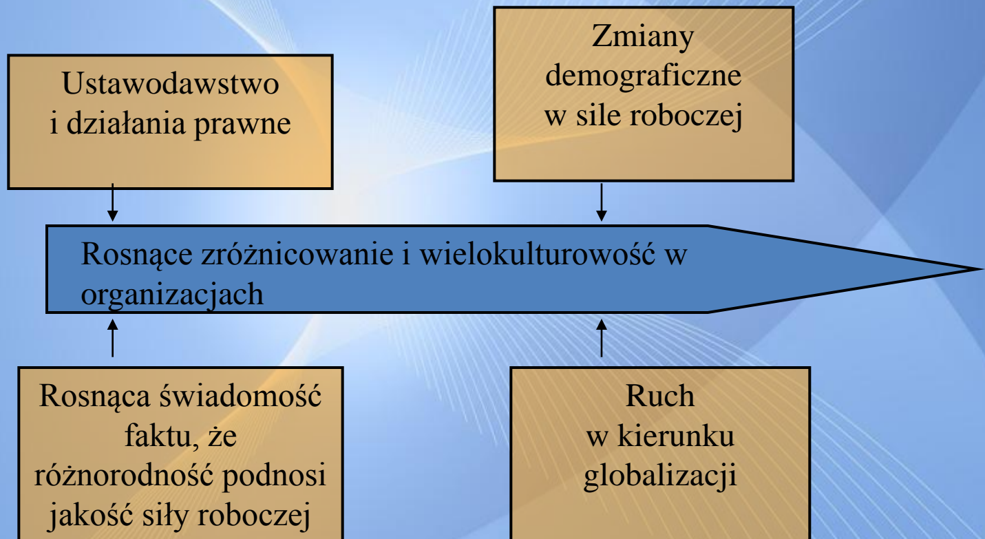
Rysunek 2 Przyczyny wzrostu różnorodności i wielokulturowości