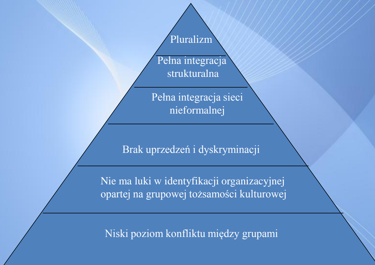
Rysunek 4 Organizacja wielokulturowa